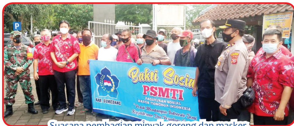
Suasana pembagian minyak goreng dan masker.