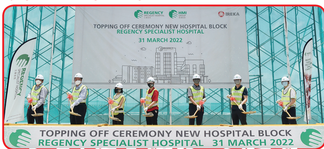
Prosesi Topping Off New Hospital Block Regency Specialist Hospital.

Untuk Malaysia, peningkatan jumlah penyakit tidak menular (PTM) diperkirakan membebani