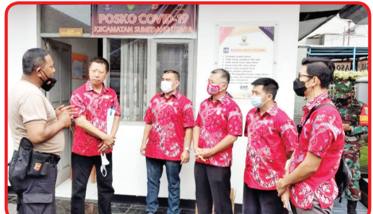
Para pengurus PSMTI Sumedang berbincang dengan anggota TNI.

dalam prbincangan tersebut, membahas mengenai visi dan misi PSMTI Sumedang.