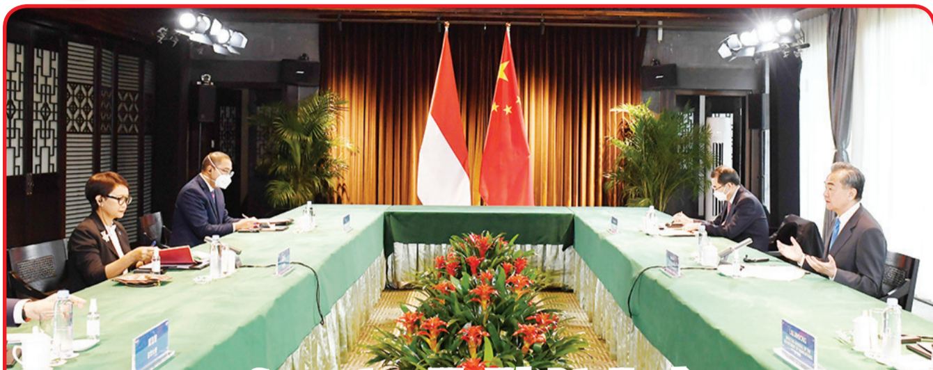
Suasana pertemuan Wang Yi dan Retno Marsudi.

ANHUI (IM) - Penasihat Negara sekaligus Menteri Luar Negeri Tiongkok Wang Yi, Kamis (31/3) lalu mengadakan pembicaraan dengan Menteri Luar Negeri Indonesia Retno Marsudi di Tunxi, Anhui, Tiongkok.