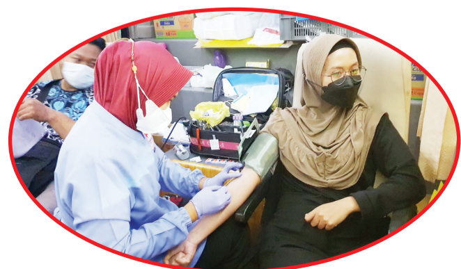
Seorang petugas PMI melayani warga yang mendonorkan darahnya.