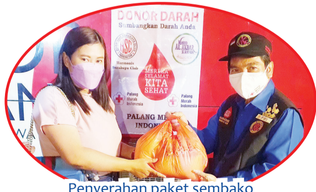
Penyerahan paket sembako untuk pendonor darah.