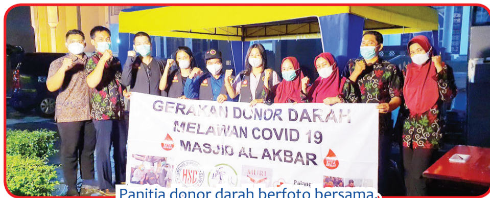
Panitia donor darah berfoto bersama.

Donor darah yang dilangsungkan di halaman Masjid Agung Al-Akbar tersebut diikuti oleh 122 warga yang mendaftar, namun hanya 47 orang saja yang dinyatakan