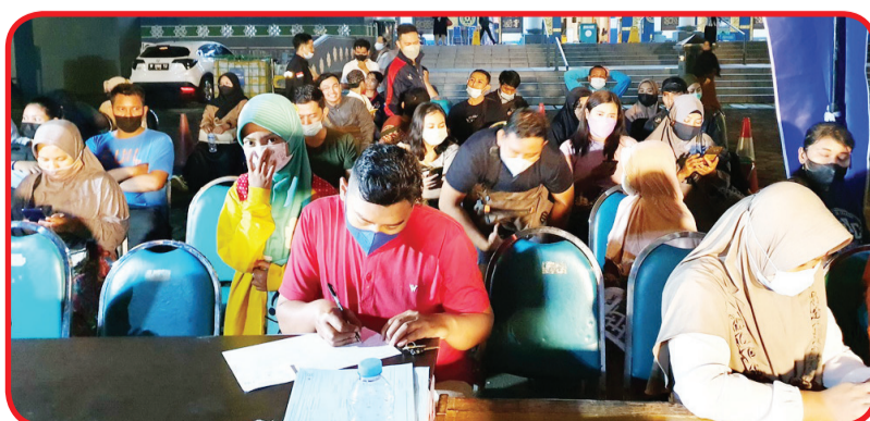
Warga yang mengantri untuk mendonorkan darahnya.